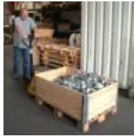
Palette heben 0:20