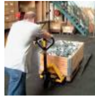
Pal. auf Waage 1:10