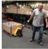
Pal. zur Waage 0:50