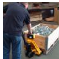
Palette wiegen 0:40