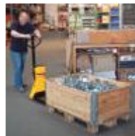
Palette heben 0:20