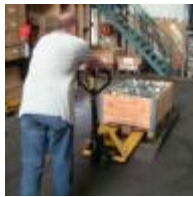
Palette heben 2:05