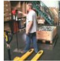
Palette wiegen 1:40