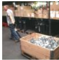
Pal. zum Lagerort 2:25